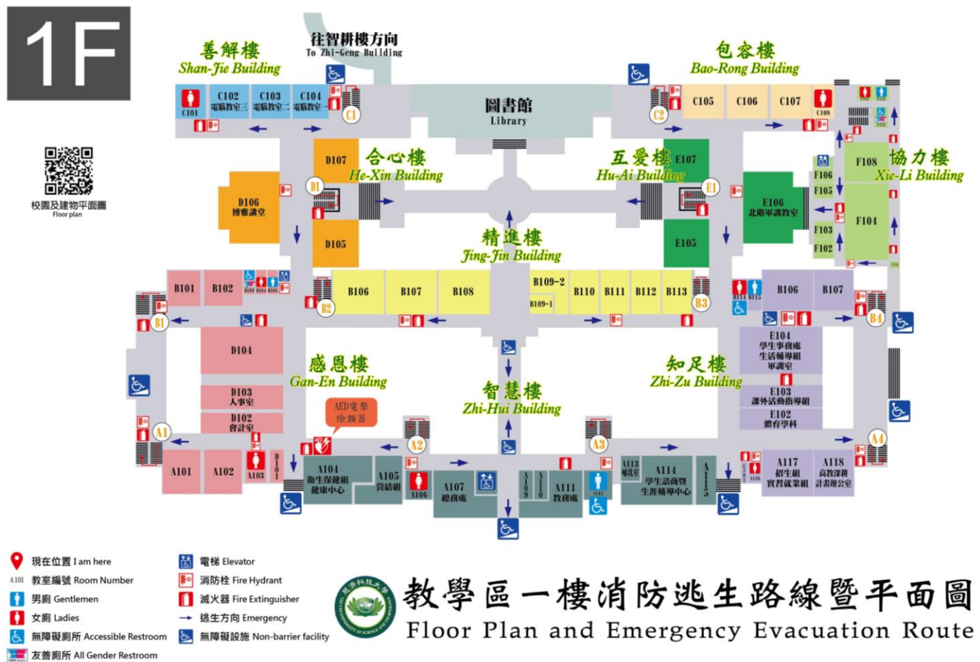
行政區一樓位置圖

本校行政單位辦公室上班時間為星期一到五，8:00~12:00 以及 13:20~17:20。